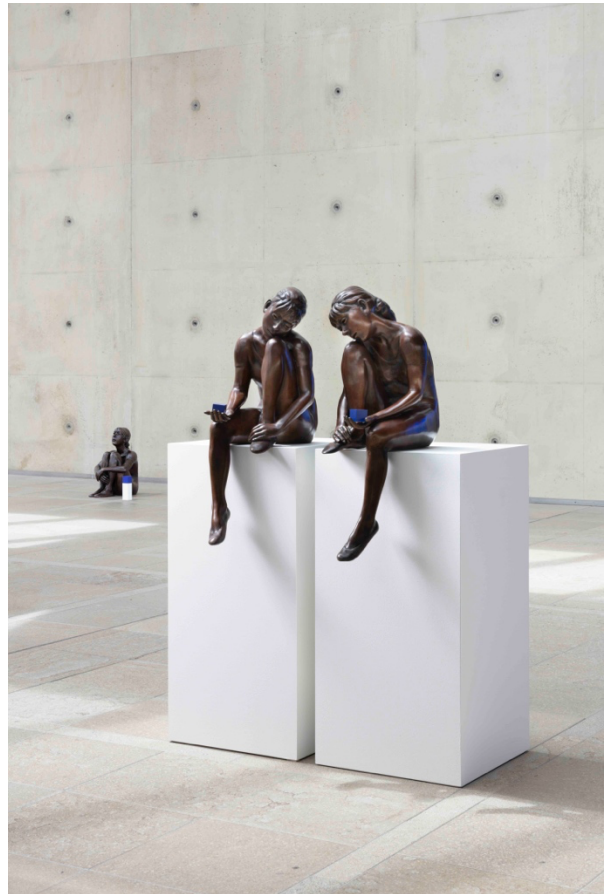
Links: Merchant of light, or, Holding hands with academia to the point where we're all kissing , 2015. Fondation Louis Vuitton, Parijs. Rechts: All things being equal, or, I'm with you , 2018, Lisson Gallery. © Ryan Gander c/o Pictoright Amsterdam 2025.

Ganders speelse sculpturen met hun poëtische titels veranderen een statisch icoon in een herkenbare, menselijke figuur, vol onzekerheden, twijfels en verlangens. Bezoekers komen het meisje tegen terwijl ze droomt, speelt of rookt – soms in zichzelf gekeerd, dan weer rebels. As old as time itself, slept alone (2016) toont haar liggend met gesloten ogen, alsof ze slaapt. De fysieke kwetsbaarheid van haar jonge