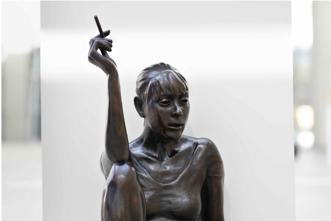
I don't blame you, or, When we made love you used to cry and I love you like the stars above and I'll love you like the stars above and I'll love you 'til I die , Ryan Gander, 2008. Burger Collection Hong Kong. © Ryan Gander c/o Pictoright Amsterdam 2025.

lichaam contrasteert met de massieve, felblauwe kubus naast haar. Ze lijkt zich al dromend af te sluiten van haar omgeving, alsof ze niet bekeken wil worden.